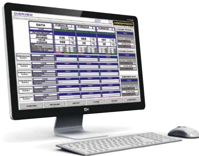
VCD-Software zur Steuerung, Visualisierung und Dokumentation

Die Bedienung ist in sieben Sprachen (DE/EN/FR/SP/IT/CH/RU) vorbereitet. Zusätzlich können ausgewählte Texte in weiteren Sprachen angepasst werden.